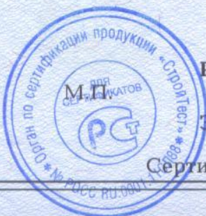
Схема сертификации За.